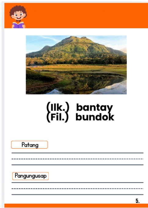
Figura 3. Nilalaman ng proyektong P.I.K.O.

Bilang bahagi ng disenyo, tiniyak na ang lahat ng halimbawa, baybay, at estruktura ng pangungusap ay sumusunod sa pinakabagong Ortograpiyang Pambansa ng Komisyon sa Wikang Filipino (KWF). Isinama rin ang mga napapanahong metodolohiya sa pagtuturo ng literasiya na kinikilala ng DepEd sa ilalim ng MATATAG Curriculum (2025–2026), na nagpapatibay sa kaugnayan at pagiging episyente ng materyal sa kasalukuyang konteksto ng edukasyon. Sa ganitong paraan, ang P.I.K.O. ay hindi lamang nakatuon sa teknikal na kaalaman kundi nakapagbibigay din ng kontekstuwalisadong suporta sa paglinang ng kasanayan sa pagsulat ng mga mag-aaral sa Baitang 3.