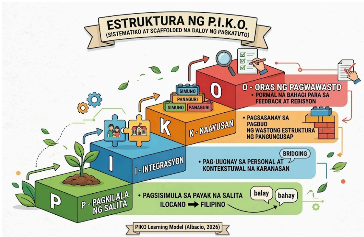
Figura 3. PIKO Learning Model (Albacio, 2026)

Ang istruktura ng P.I.K.O. ay sistematiko at scaffolded , sumusunod sa lohikal na daloy ng pagkatuto: