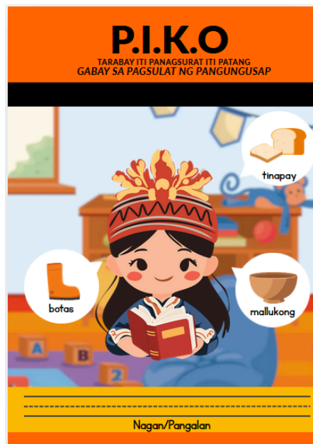
Figura 2. Pabalat ng proyektong P.I.K.O.

Sa pamamagitan ng pagsasanib ng empirikal na datos at mga pedagogical observation, nabuo ang P.I.K.O. bilang isang contextualized remediation tool . Higit pa sa simpleng pagwawasto ng balarila, layunin ng modelong ito na gawing mas inklusibo ang proseso ng pagtuturo sa pamamagitan ng pagkilala sa Funds of Knowledge ng mga mag-aaral sa Laur. Sa ganitong paraan, nagsisilbing tulay ang interbensiyon na nag-uugnay sa katutubong wika at karanasan ng mag-aaral patungo sa mas sistematiko at pormal na kasanayan sa pagsulat sa Filipino.